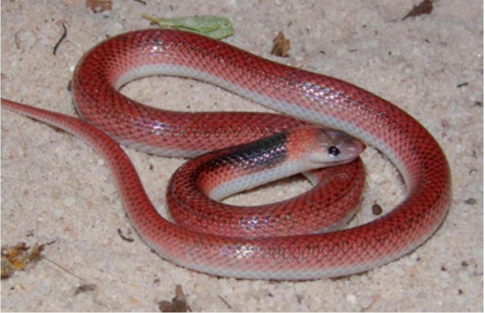
Abb. 11: Phimophis scriptorcibatus . Endemit des östlichen Dünenfelds. / Endemic species to the eastern dunefields.