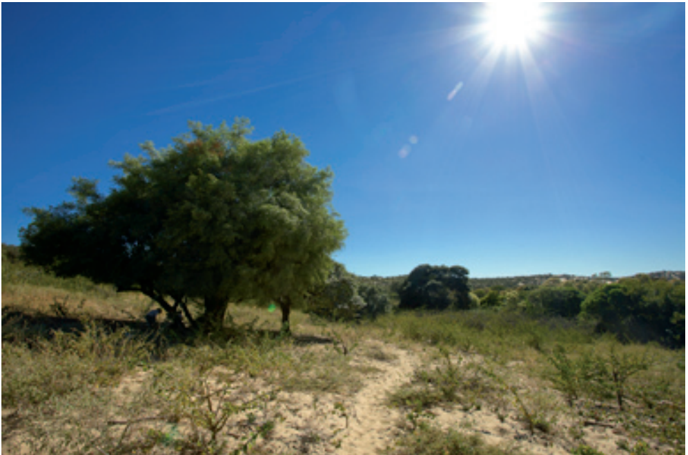
Abb. 1: Landschaftsaufnahme des südwestseitigen Dünenfeldes bei Ibiraba (Bahia). / Landscape at the southern, westerly dunes close to Ibiraba (Bahia).

arid Caatinga and are interpreted as a relictual habitat from a once drier period. They exhibit a highly diverse herpetofauna and have been subject to numerous taxonomic and ecological studies. Together with a brief introduction to the region it is the purpose to present an overview of the species distributed there. Recent taxonomic changes have been incorporated and species names have been updated. There are 59 species recognized (and at least 7 wait for their formal description), of which 19