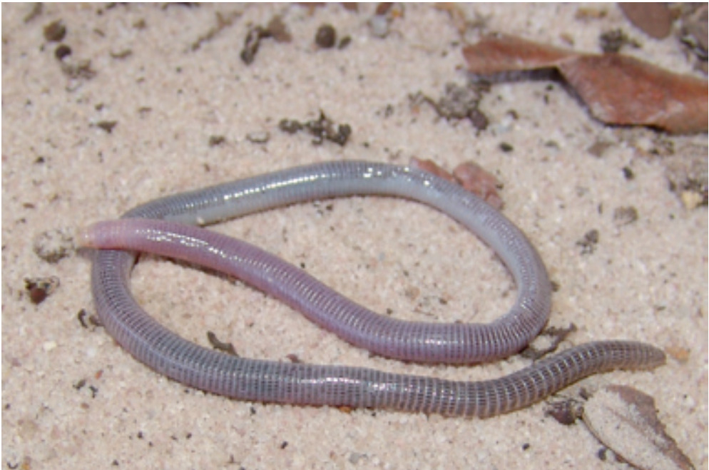
Abb. 4: Amphisbaena ignatiana . Dieser Endemit stammt vom östlichen Dünengebiet. / This endemic species is from the eastern dunefield.

tigte Arten). Von diesen sind mindestens 19 Endemiten, was eine hohe Gesamtendemismusrate von 32 % bedeutet. Die Gymnophthalmiden sind mit sechs endemischen von insgesamt neun nachgewiesenen Arten das Taxon mit der sowohl relativ (67 %), als auch absolut höchsten Endemismusrate. Zumindest absolut gesehen folgen dichtauf die Schlangen, die durch mindestens fünf der insgesamt 23 nachgewiesenen Arten (22 %) nur dort vertreten sind. Ohne die unbeschriebenen Arten zu berücksichtigen, kommen in diesem Gebiet, das nicht einmal 0,1 % der Gesamtlandesfläche einnimmt, 9 % aller Squamatenarten vor. Allein die Endemiten also stellen knapp 3 % der brasilianischen Squamatenfauna dar! Gesamtartenzahl im Dünengebiet, Anzahl der für das Dünengebiet endemischen Arten und die Anzahl der in ganz Brasilien nachgewiesenen Arten (nach BÉRNILS 2010), sowie die daraus resultierenden Endemismusraten sind in Tabelle 1 zusammengefasst.