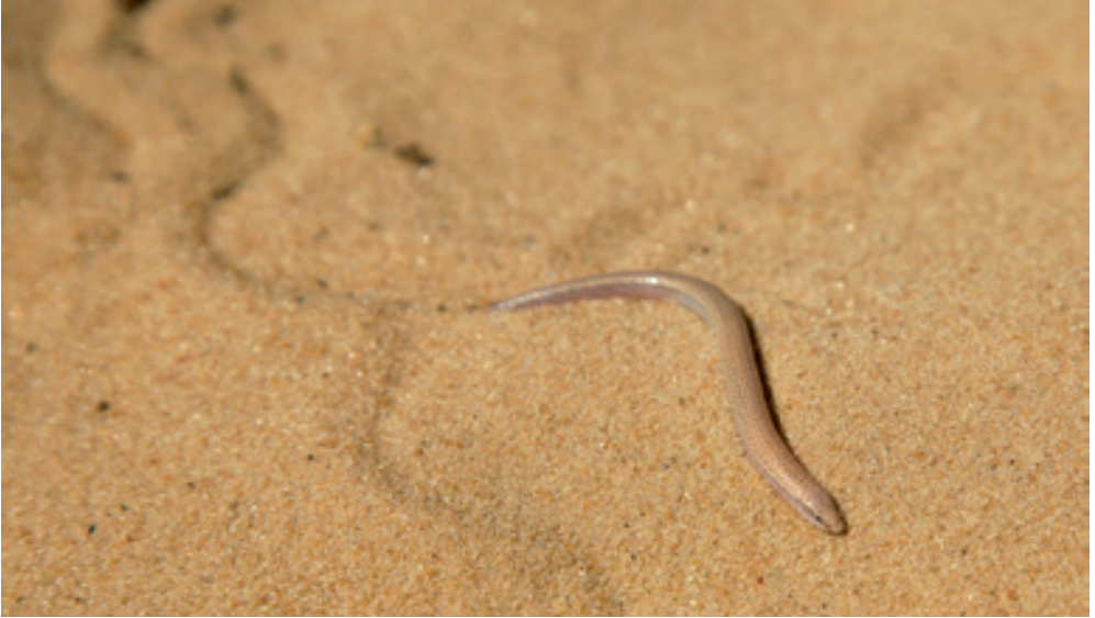
Abb. 9: Calyptommatus leiolepis . Nach dem Freilassen verharrte dieses Exemplar ca. 15 sec regungslos und verschwand nicht wie seine Artgenossen sofort im lockeren Sand. Links im Bild sind die typischen Fährten im Sand zu erkennen. / In contrast to conspecifics, this specimen did not move at all for about 15 sec before disappearing into the soil. Left in the picture are the typical tracks shown.