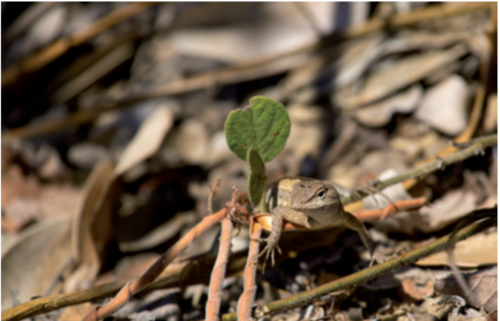
Abb. 6: Eurolophosaurus divaricatus . In der Laubstreu nur schwer auszumachen. / Hard to detect in leaf litter.