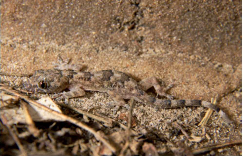
Abb. 5: Hemidactylus mabouia . Eine kürzlich eingewanderte, invasive Art. / A recently arrived invasive species.