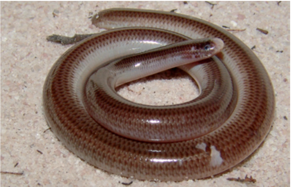
Abb. 12: Typhlops yonenagae . Eine weitere endemische Art der östlichen Dünen. / Yet another species endemic to the eastern dunes.