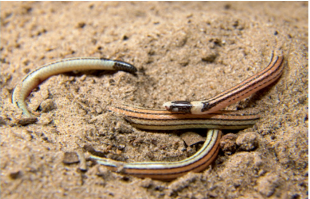
Abb. 10: Apostolepis gaboi . Der Fund dieser eher seltenen Art war ein glücklicher Zufall. / The catch of this rather rare species was a lucky accident.