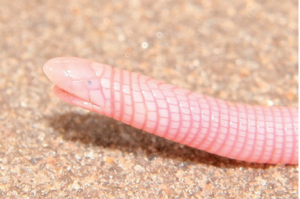
Abb. 3: Amphisbaena hastata . Der Körperdurchmesser dieser Art beträgt gerade mal 2-3 mm. / The body diameter of this species roughly measures 2-3 mm.

wachsen und Sukkulenten beherrscht (COLE 1960). Im Bundesstaat Bahia, der den meisten Brasiliantouristen eher durch die ihm namensgebenden Buchten und Strände bekannt ist, liegt im Nordwesten ein etwa 7000 km 2 großes fossiles Dünengebiet am Mittellauf des Rio São Francisco (Abb. 1). Fossil bedeutet in diesem Zusammenhang, dass für die Region bis zum Ende der letzten Kaltzeit (etwa vor 10.000 Jahren) ein wüstenähnliches Klima angenommen wird und die heute teils überwachsenen, semistabilen Parabeldünen (durch Windeinwirkung entstandene Dünen mit konkaver Luvseite) als Relikt dessen angesehen werden. Der Rio São Francisco, der im südlichen Minas Gerais entspringt und nach über 3000 km in den Südatlantik mündet, teilt dieses größte Dünenfeld Südamerikas in einen östlichen und einen westlich davon gelegenen Bereich und stellt somit eine wirkungsvolle geographische Barriere dar. Auf der Westseite sind die Dünen im südlichen Teil zwischen 20 und 100 m hoch